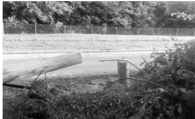
Atlanta Bos, Verenigde Staten, 2022

braken in bij televisiestudio's, terwijl de politieke en eco- nomische crisis tot een climax leek te komen. De woede kwam eerder deze maand tot uitbarsting toen tienduizen- den mensen de straat opgingen in Colombo. Er werden toen meerdere huizen van politici in de fik gezet.