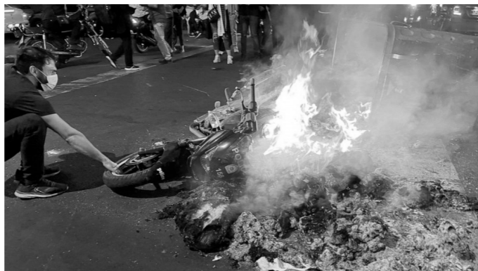
Iran, oktober 2022

Bij een streekrave tegen gentrificatie liep het uit de hand. Stillen gingen mensen oppakken met verschillende redenen: van stickers plakken tot openbaar drugsgebruik en een clown die zei: 'he, collega's'. Bij één van deze arrestaties stuitten zij op verzet en werden ze zelf aangevalen met duwen, trekken, slaan en bierblikjes. Een stillen