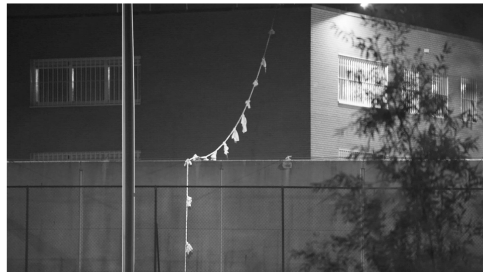
Alphen, oktober 2022

In Alphen aan den Rijn werd een ontsnappingspoging gedaan uit de gevangenis op de ouderwetse manier: er hing een touw van aan elkaar geknoopte lakens vanaf het dak van de gevangenis naar de buitenmuur. Hoe aan zoveel lakens gekomen kon worden is niet duidelijk. Degene die probeerde te ontsnappen had ook de ruit en de tralies uit zijn cel verwijderd. Helaas werd hij binnen de muren van de gevangenis gesnapt en in de isoleercel gezet.