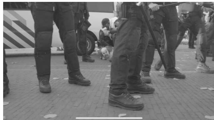
Amsterdam, oktober 2022

bus werd geblokkeerd door mensen en pallets, ook lieten mensen de banden leeglopen.